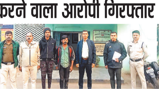
पुलिस गिरफ्त में आरोपी पति।