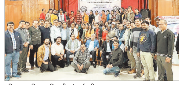
प्रशिक्षण उपस्थित अधिकारी एवं कर्मचारी।