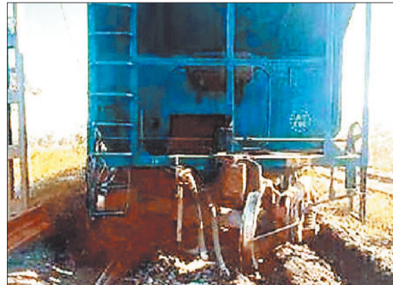
डीरेल हुई मालगाड़ी।

कोयला खदान से आने वाली लोड मालगाड़ियों के चक्कों के पटरी से उतरने जैसी घटनाएं सामने आती रहती है। बीते शुक्रवार को ऐसी ही एक घटना सामने आई। जब जुनाडीह साइडिंग से कोयला लेकर कोरबा की ओर आ रही मालगाड़ी चार चक्के पटरी से उतर गए। जिससे यातायात लगभग 3 घंटे बाधित रहा। इससे रेलवे और एसईसीएल प्रबंधन को काफी नुकसान हुआ है। इस संबंध में जो जानकारी सामने आई है उसके अनुसार